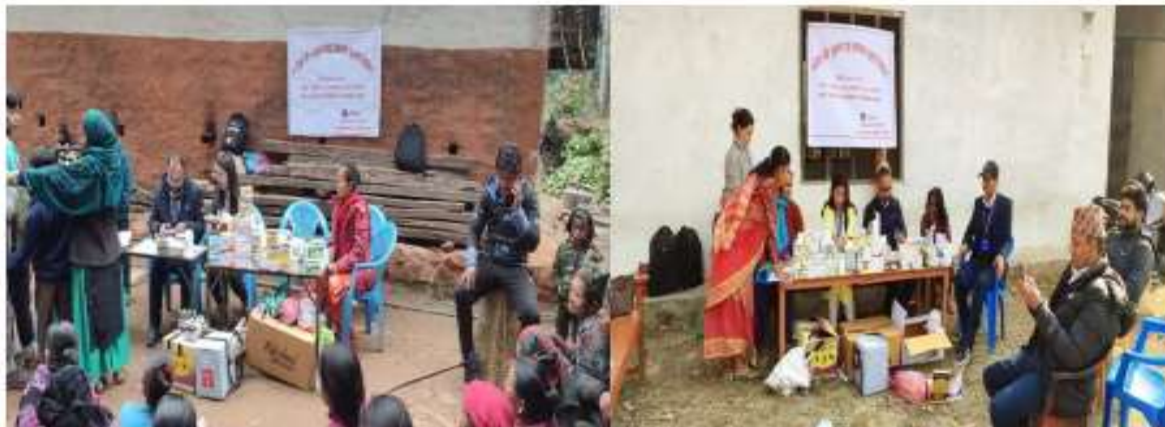
पशु स्वास्थ्य घुम्टी शिविर वडा नं.६ र ९