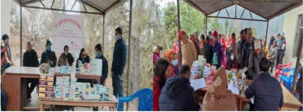
पशु स्वास्थ्य घुम्टी शिविर वडा नं.५