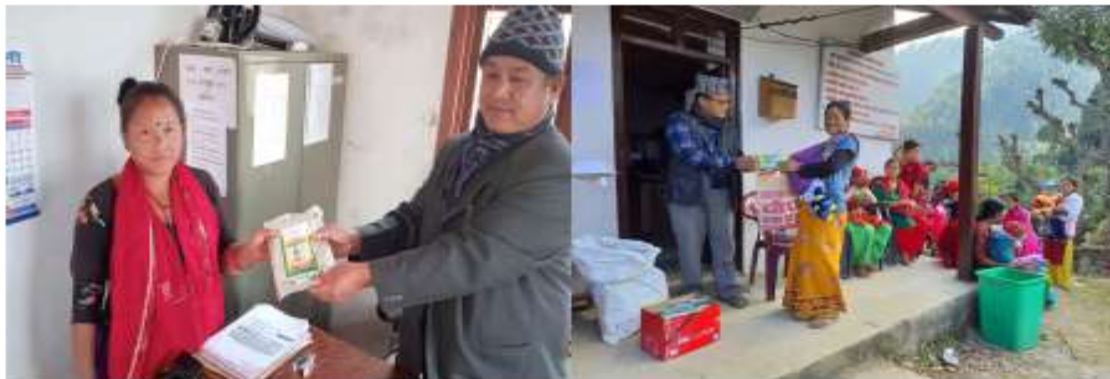
मागमा आघारित बिउ वितरण कार्यक्रम अन्तर्गत तरकारी खेती गर्ने कृषकहरूलाई तरकारीको बिउ वितरण गर्ने क्रमशः बडा नं. ५ र ६