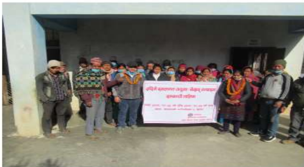
अदुवा बेसारको पकेट कार्यक्रम अन्तर्गत दह अदुवा बेसार पकेट क्षेत्रका २६ जना सदस्यहरूलाई ३ दिने स्थलगत तालिम संचालन पश्चात लिएको तस्वीर